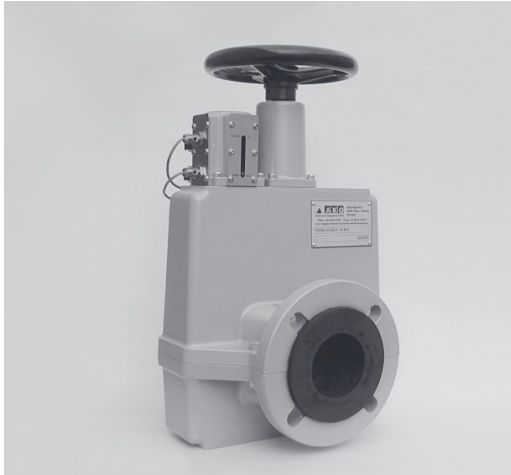
Manuelle Betätigung Manual operation