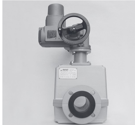
Elektromechanische Betätigung Electro-mechanical operation

▲ Das neu entwickelte Schlauchquetschventil mit freiem Ventildurchgang dient zum Absperrn von abrasiven, fasrigen, porösen und zähflüssigen Medien, wie z.B. Granulate, Schlämme, Suspensionen.